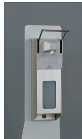
RAL 9016 mit Aluminiumdispenser 0,5 Liter