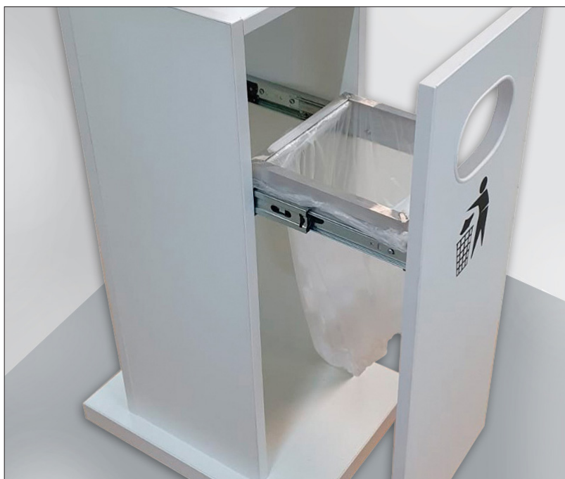
Abb.: Ausziehbarer Abfallkorb