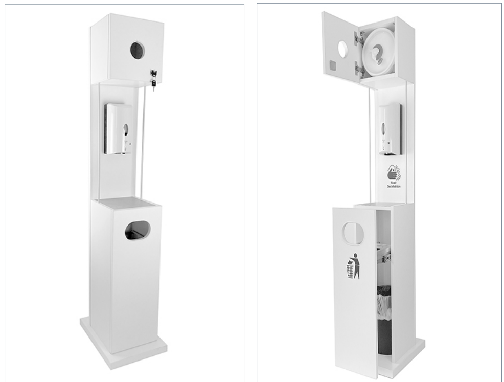
Abb.: Hygienestation Variante 1 mit Feuchttuchspender

Sie sind flexibel konfigurierbar. Maße, Farbe und Branding können auf Ihre Wünsche angepasst werden.