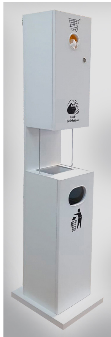
Abb.: Variante mit verdecktem Desinfektionsmittelpender