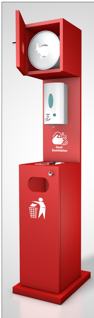
Abb.: Variante in rot